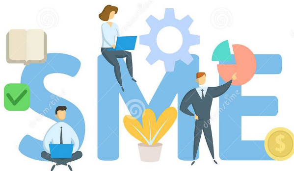
Small and Medium Enterprise

លោក អ៊ាម ចណ្ណា មានបទពិសោធន៍ការងាររយៈពេលជាង៨ឆ្នាំទាក់ទងនឹងវិស័យហិរញ្ញវត្ថុនិងប្រតិបត្តិការឥណទានធនាគារ និងមីក្រូហិរញ្ញវត្ថុ។